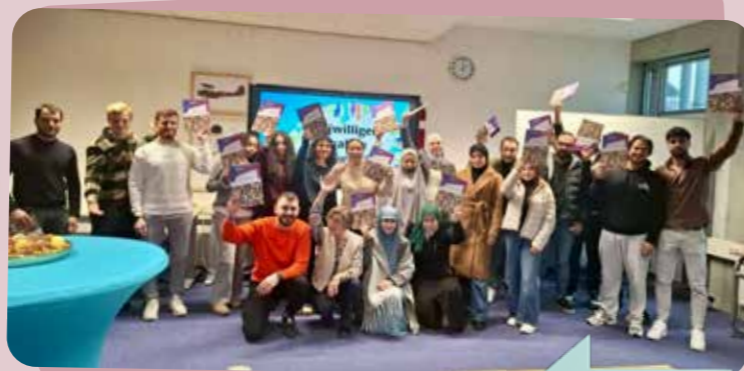
↑ Certificaatuitreiking Onderwijsroute

Deventer Doet ondersteunt inburgeraars binnen alle inburgeringsroutes, met aandacht voor talent, taal en participatie.