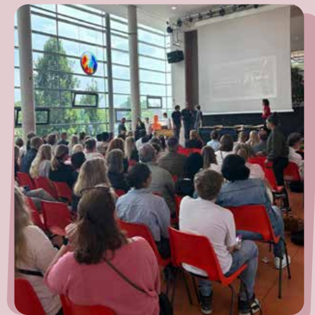
↑ Certificaatuitreikingen leerlingen hebben hun MDT-traject succesvol afgerond

Ook op de Internationale Schakelklas (ISK) was Impacter wekelijks aanwezig. Hier rondden 10 jongeren een MDT-traject af, met een breder bereik via vrijwilligerswerk in buurthuizen en maatschappelijke initiatieven.