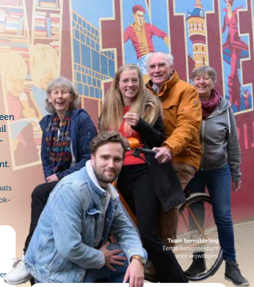
Team bemiddeling Eerste aanspreekpunt voor vrijwilligers

Op één dag vonden 6 gesprekken plaats: 3 op afspraak en 3 spontane binnenlopers.