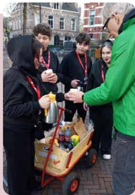
↑ BSK 4/5 hielp mee tijdens het Dickens Festijn om te proeven aan de sfeer van het evenement