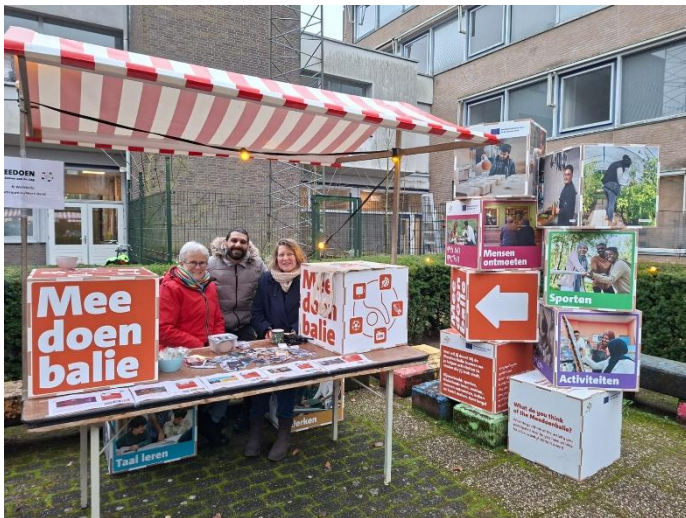
Coördinator #meedoen van VCW met het #meedoenteam op AZC's Bosrandweg

haven, 'Het Stek' geheten omdat het schip zou vertrekken. Het ging om tijdelijke opvang. Zo bleven er twee #meedoenbalies over om te coördineren.